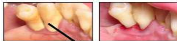
Sarro o Cálculo